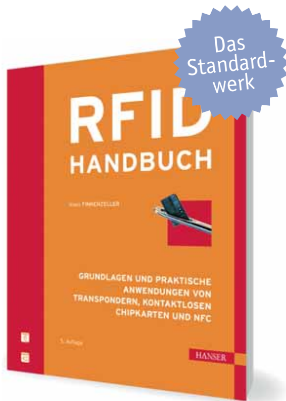
Klaus Finkenzeller RFID Handbuch Grundlagen und praktische Anwendungen von Transpondern, kontaktlosen Chipkarten und NFC

254 Seiten. FlexCover. Mit eBook. € 34,90. ISBN 978-3-446-40507-3